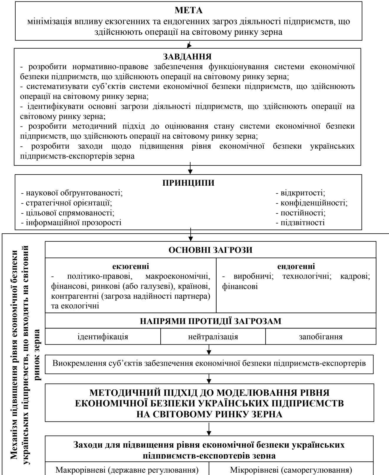
Рис. 3. Основні складові концептуального підходу до забезпечення економічної безпеки українських підприємств на світовому ринку зерна