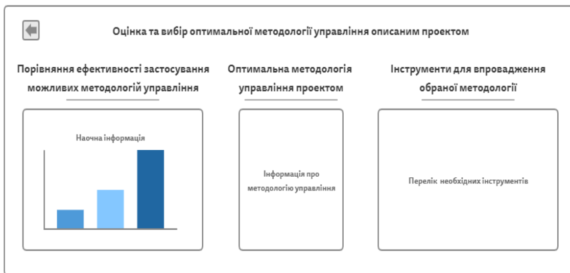
Рис. 3. Сторінка оцінки та вибору оптимальної методології управління

Висновки. В статті подано результати аналізу сутності та принципів методологій управління IT-проектами та створення програмного продукту. Розглянуто найпопулярніші з існуючих підходів, визначено їх зміст, історію формування, переваги та недоліки, а також сфери застосування, щодо різних типів IT-проектів. Здійснено порівняння даних підходів за визначеними критеріями. Сформовано бачення щодо формування інтегральної оцінки обрання оптимальної до конкретного IT-проекту методології.