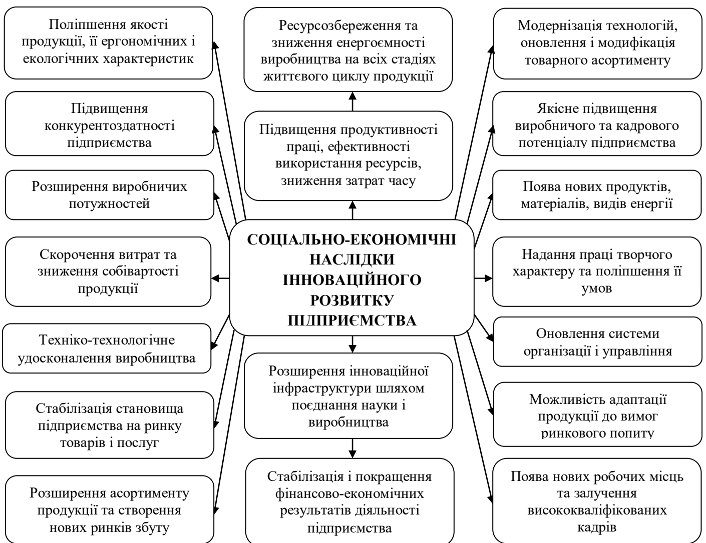
Рис. 2. Соціально-економічні наслідки інноваційного розвитку підприємства

Досвід високорозвинених країн засвідчує, що лише держави, які використовують високі технології, створюючи велику частину доданої вартості, здатні займати лідируючі позиції за рівнем технологічного і соціально-економічного розвитку. Розвиток економіки швидкими темпами за рахунок виробництва та експорту наукомісткої продукції підтверджується досвідом Японії, Тайваню, Південної Кореї, Сінгапуру, Гонконгу, Іспанії, Чилі та інших країн.