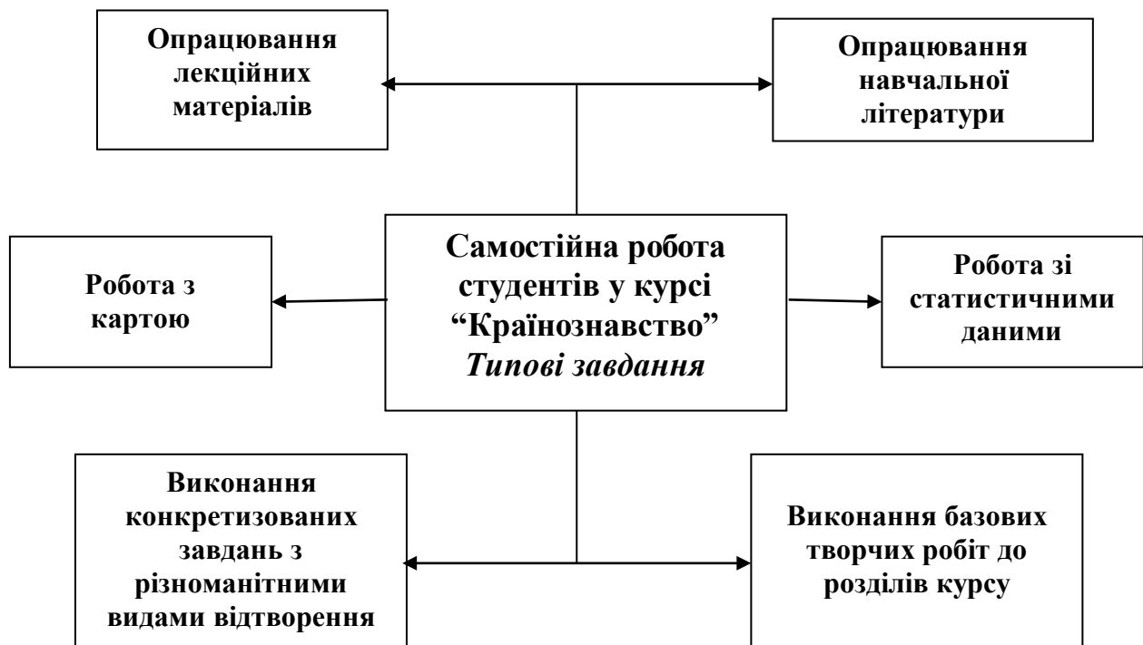
Рис.1. Типові завдання для СРС у курсі “Країнознавство”.

Опрацювання лекційних матеріалів сприяє актуалізації знань студентів отриманих в аудиторії та полегшує подальшу роботу при підготовці до практичного заняття.