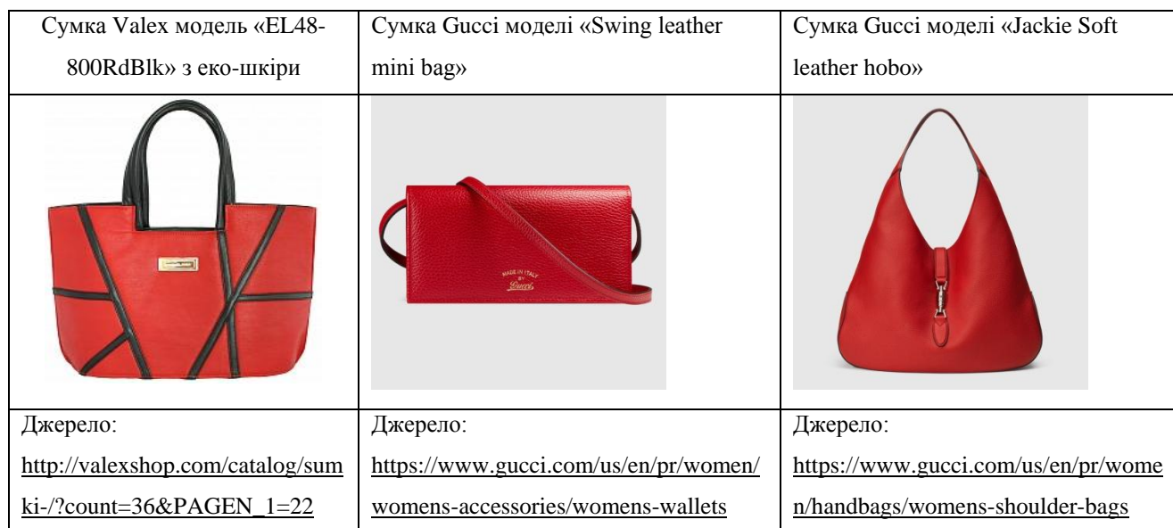
Рис.1. Сигнально-демонстративні ефекти жіночих сумок на прикладі брендів Valex та Gucci.

Вочевидь, жінка, яка носить сумку Gucci моделі «Jackie Soft leather hobo» (коштує 2990$) демонструє дещо інше соціально-економічне становище у порівнянні з жінкою, яка носить сумку Gucci моделі «Swing leather mini bag» (коштує 660 $) або сумку вітчизняного виробника Valex моделі «EL48-800RdBk» з еко-шкіри (коштує 500 грн.).