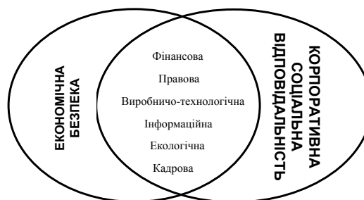
Рис. 1. Складові економічної безпеки та корпоративної соціальної відповідальності підприємства

Отже, в будь-якому випадку для зміцнення рівня економічної безпеки промислового підприємству необхідно спрямовувати зусилля на вдосконалення управління власною діяльністю за низкою напрямів (рис. 1).