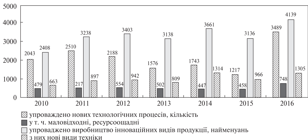
Рис. 1. Упровадження інновацій на промислових підприємствах

За цей же період найвища частка інноваційних підприємств була на підприємствах інформації та телекомунікації (22,1 %), переробної промисловості (21,9 %), фінансової та страхової діяльності (21,7 %), у сфері архітектури та інжинірингу (20,1 %). Лідерами за рівнем інноваційної активності були підприємства Рівненської, Харківської областей та м. Київ.