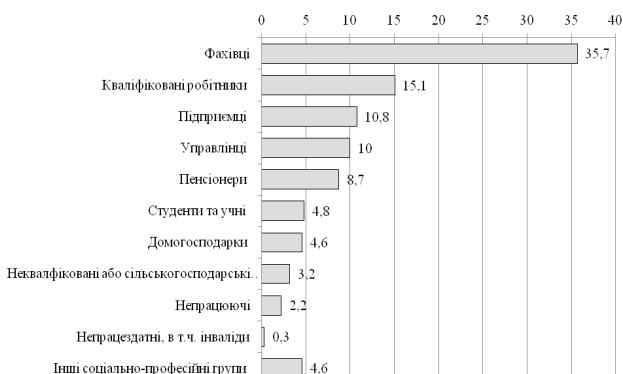
Рис. 1. Структура середнього класу за соціально-професійними групами у 2014 р., %

Охоплюючи різні соціальні групи, середній клас є неоднорідним, або гетерогенним. В його структурі можна виокремити верхні, середні та нижні прошарки (принаймні за доходами), а також частини так званих старого і нового середнього класів.