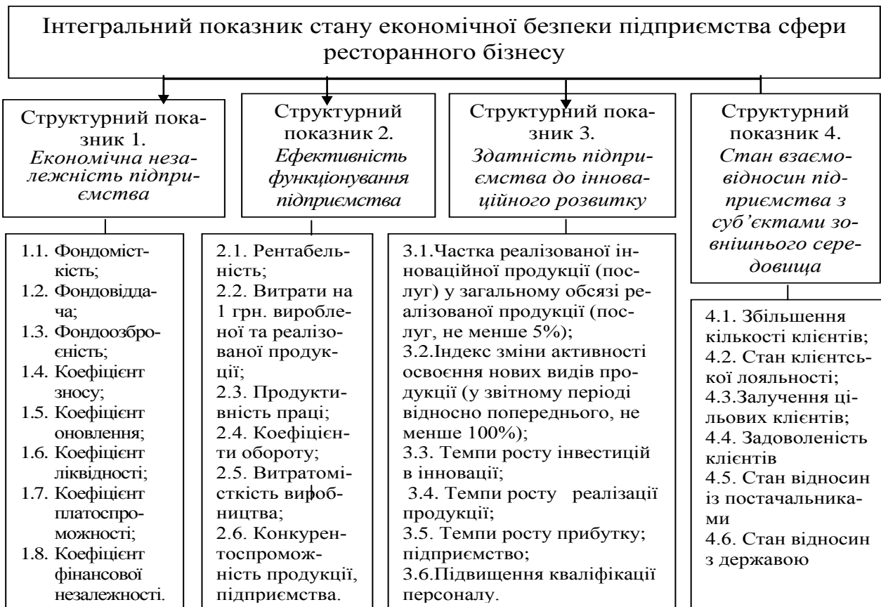
Рис. 2. Класифікація показників, що комплексно характеризують стан економічної безпеки підприємства сфери ресторанного бізнесу

Інтегральний показник стану економічної безпеки підприємства розраховується за формулою: