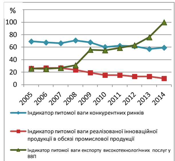
Рис. 3. Динаміка вибраних індикаторів інноваційної безпеки (складено автором)

інноваційної активності негативно відображається на стані виробничої безпеки. Технічний стан основних засобів у базових галузях української економіки представляє загрозу її стабільному функціонуванню. Внаслідок зниження ступеня зносу основних засобів (з 56,9 % у 2013 р. до 60,3 % у 2014 р.) індикатор стану виробничої безпеки у промисловості сягнув незадовільного рівня.