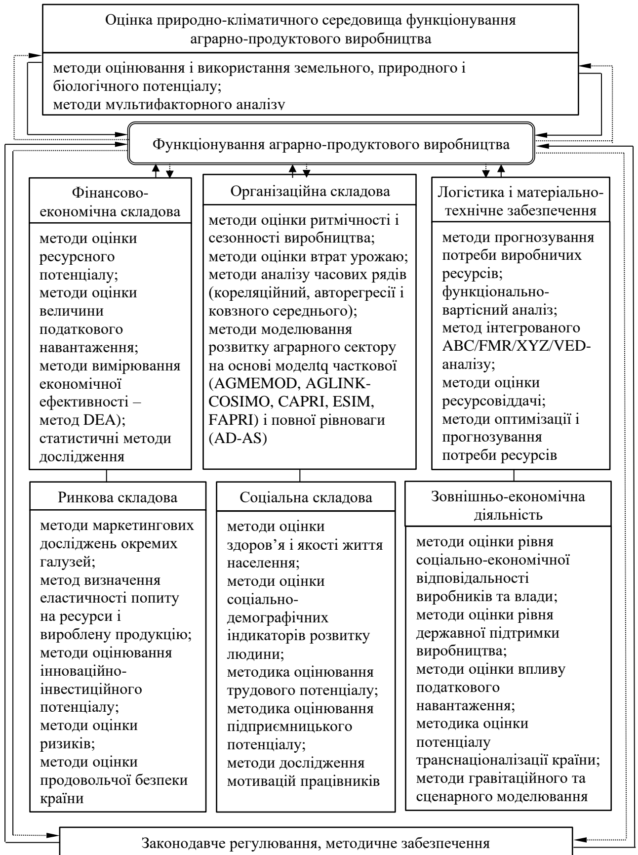
Рис. 2. Методологічне забезпечення функціонування аграрно-продуктового виробництва України