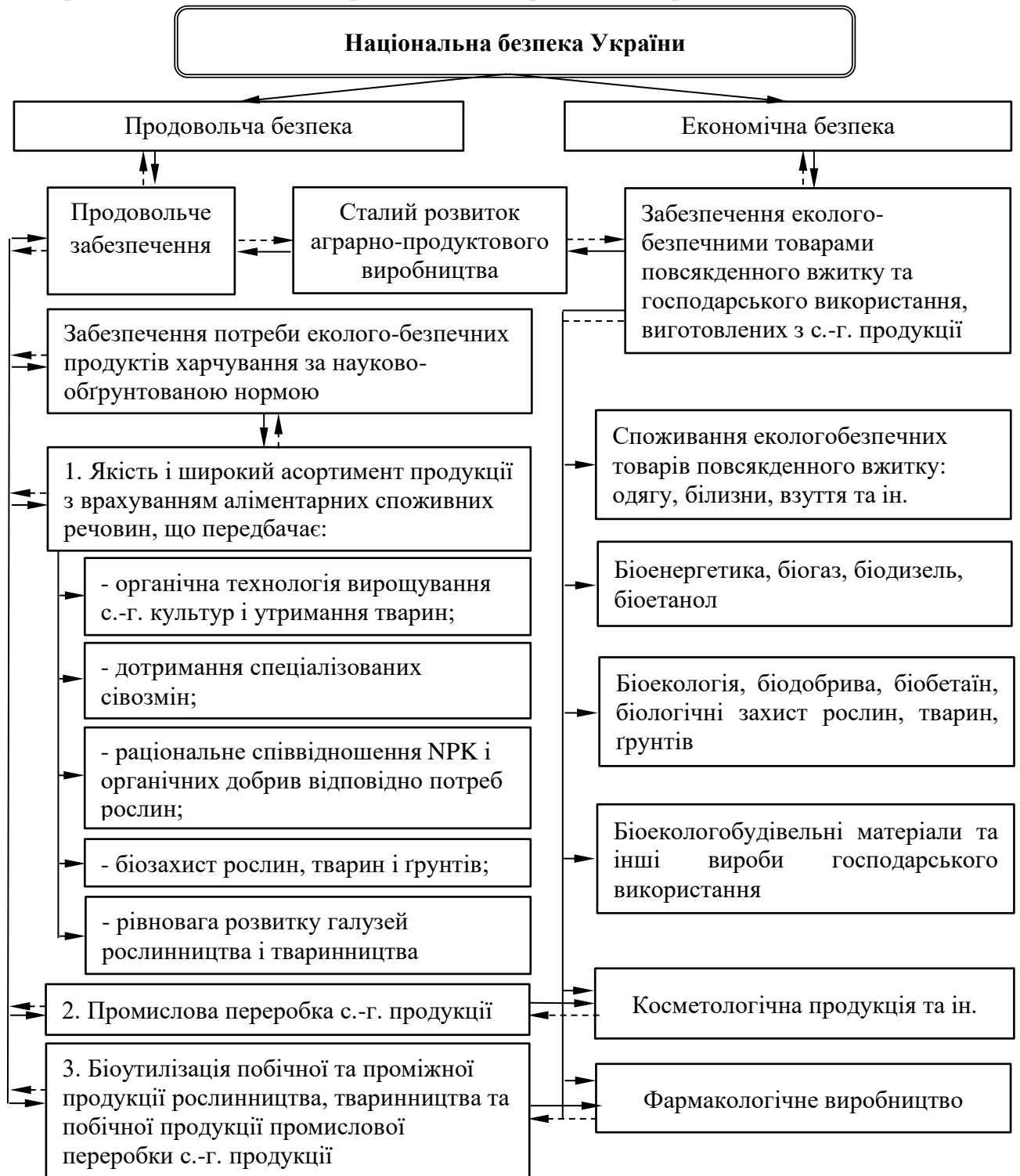
Рис. 4. Концептуальна модель сталого розвитку аграрно-продуктового виробництва в системі національної безпеки України

мінерального виснаження ґрунтів, їх мінералізації і ерозії.