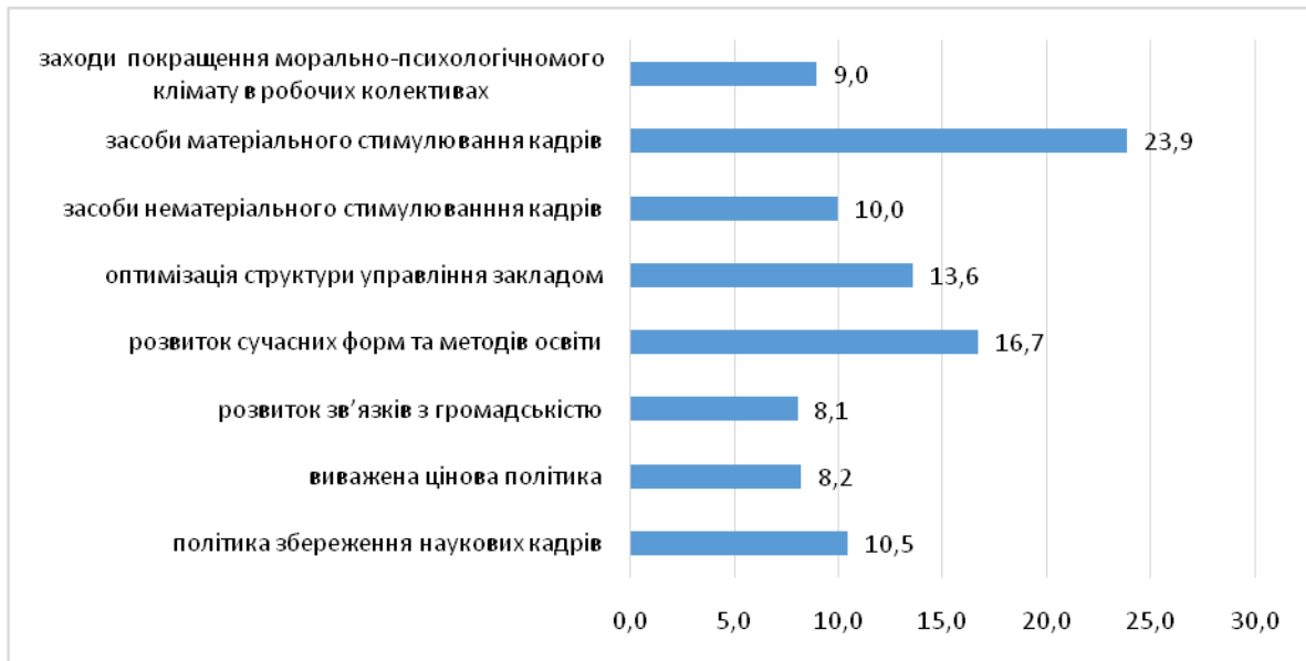
Рис. 1. Співвідношення питомої ваги різних засобів впливу на підвищення рівня економічної безпеки ВНЗ