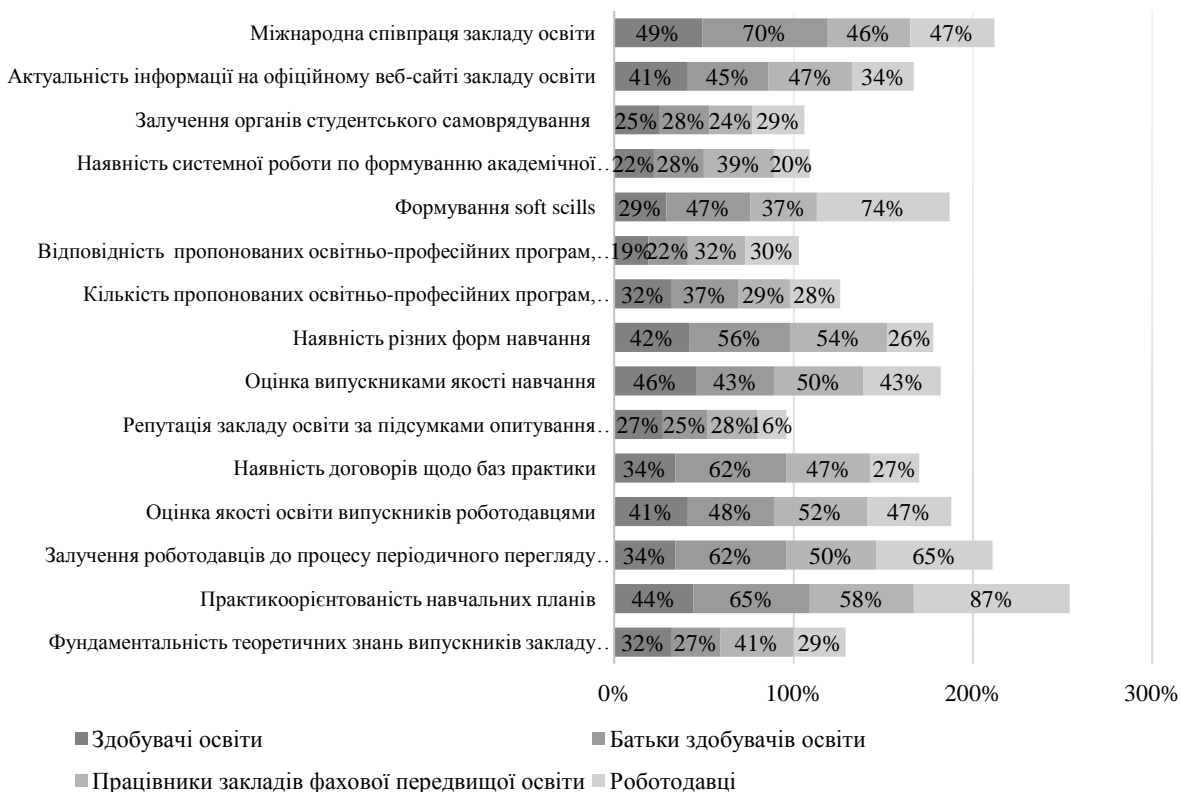
Рис. 2. Відповіді респондентів щодо пріоритетів, які можуть впливати на вибір закладу фахової передвищої освіти

Найвідомішим рейтингом, на який звертають увагу при виборі закладу освіти, здобувачі, їх батьки та працівники назвали Консолідований рейтинг закладів вищої освіти України Інформаційного освітнього ресурсу «Освіта.ua». В свою чергу, роботодавці вказали рейтинг «Топ закладів освіти за оцінками роботодавців».