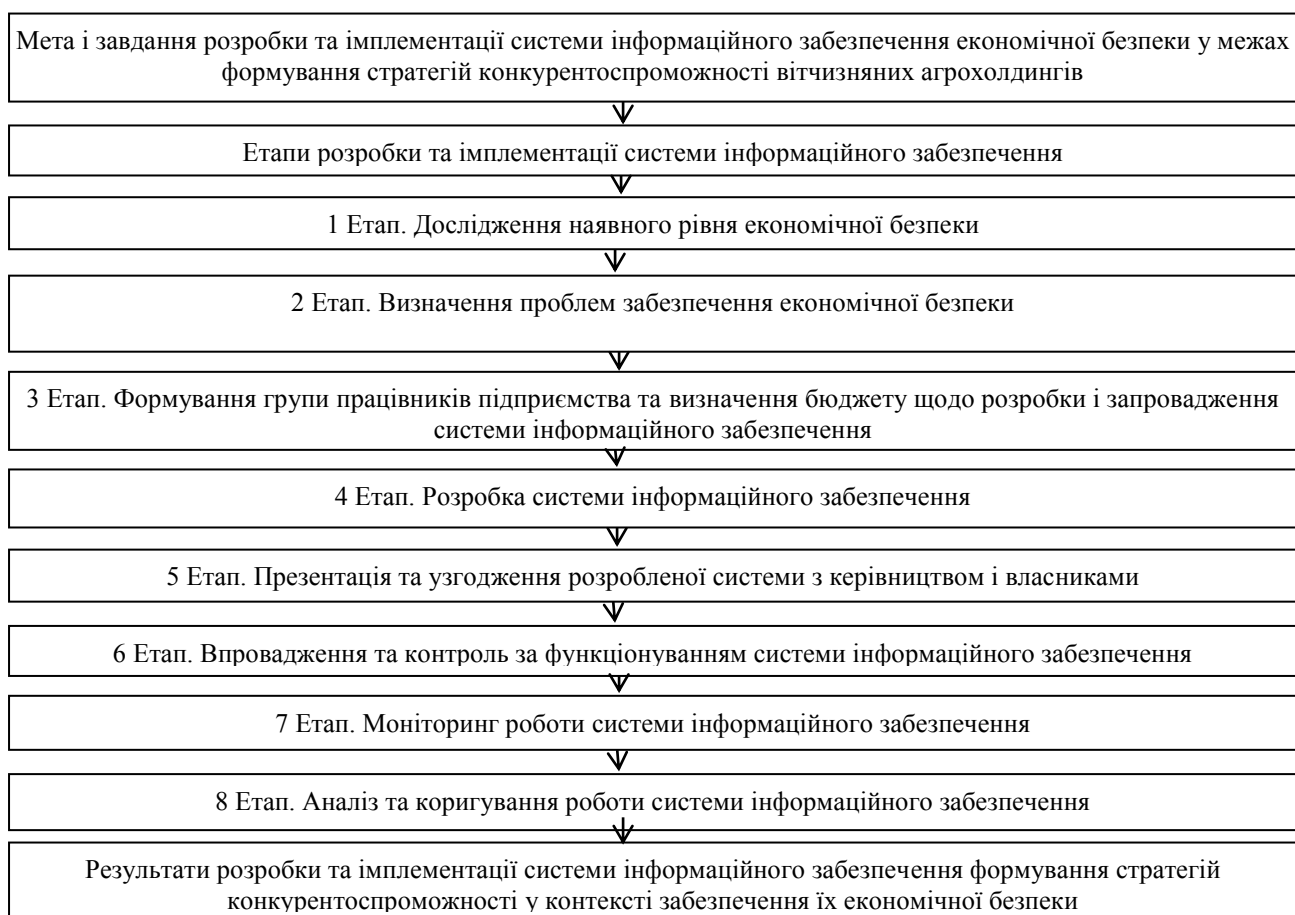
Рис. 2. Процедура розробки та імплементції системи інформаційного забезпечення економічної безпеки засобами стратегій конкурентоспроможності вітчизняних агрохолдингів

Процедуру розробки та імплементції системи інформаційного забезпечення економічної безпеки інструментами стратегій конкурентоспроможності вітчизняних агрохолдингів запропоновано здійснювати у декілька етапів (рис. 2).