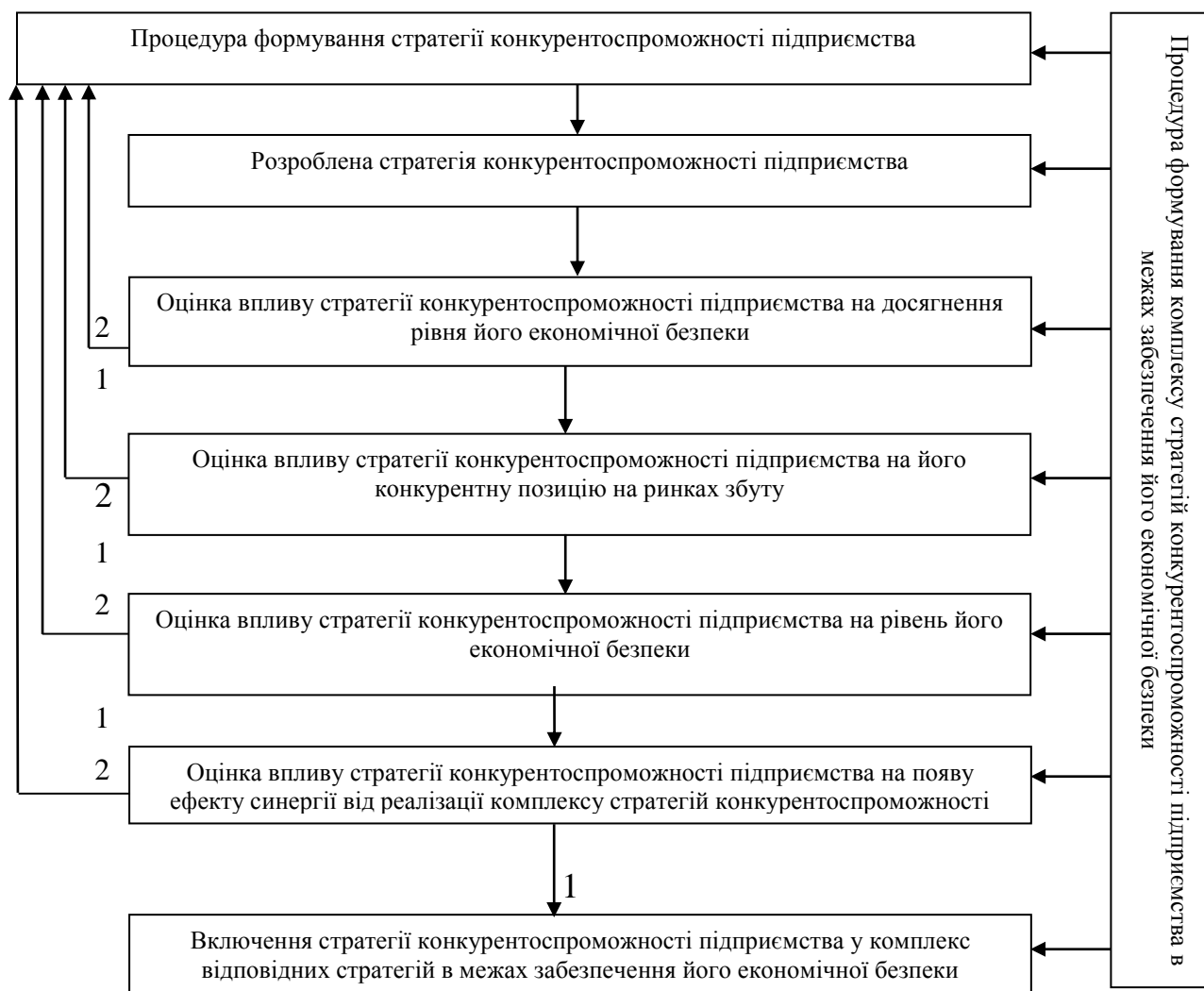
Рис. 4. Алгоритм відбору стратегії конкурентоспроможності агрохолдингів для забезпечення їх економічної безпеки

У п. 3.3 «Механізм реалізації стратегій забезпечення економічної безпеки агрохолдингів інструментами конкурентоспроможності» розроблено механізми реалізації окремої стратегії та комплексу стратегій конкурентоспроможності для забезпечення економічної безпеки агрохолдингів. Автором була розроблена і використана модель оцінки стратегії конкурентоспроможності (комплексу стратегій конкурентоспроможності) та економічної безпеки підприємств на основі моделі оцінки ймовірності банкрутства, яка була запропонована Дж. Аргенті (А – рахунок).