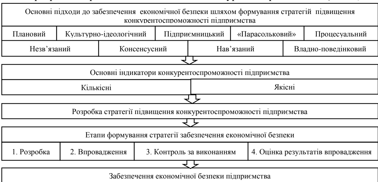
Рис. 1. Основні складові концептуального підходу забезпечення економічної безпеки підприємства на основі розробки стратегії підвищення його конкурентоспроможності

У п. 1.3. «Методологічні принципи забезпечення економічної безпеки підприємства шляхом розробки стратегій підвищення його конкурентоспроможності» наголошено на тісному взаємозв'язку між потенціалом забезпечення економічної безпеки та стратегією підвищення конкурентоспроможності підприємства, що дозволяє виділити основні складові концептуального підходу забезпечення економічної безпеки підприємства на основі розробки стратегії підвищення його конкурентоспроможності (Рис. 1).