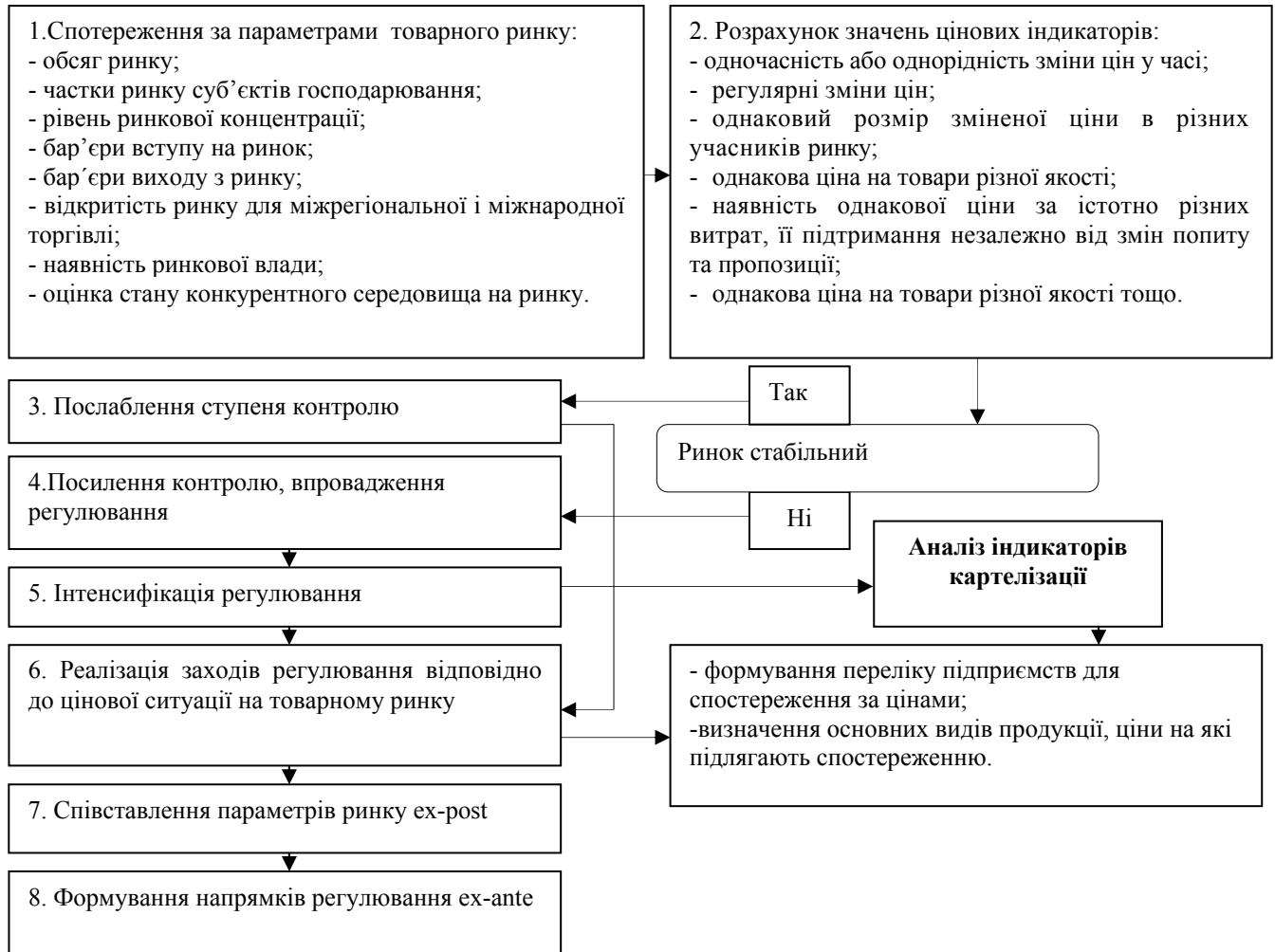
Рис. 4. Алгоритм контролю за процесами картелізації ринків на основі цінових індикаторів

Після з'ясування факту впливу показників картелізації на основні показники макроекономічної стабільності моніторинг картелізації має продовжуватись на рівні окремих ринків. Алгоритм такого моніторингу подано на рисунку 4.