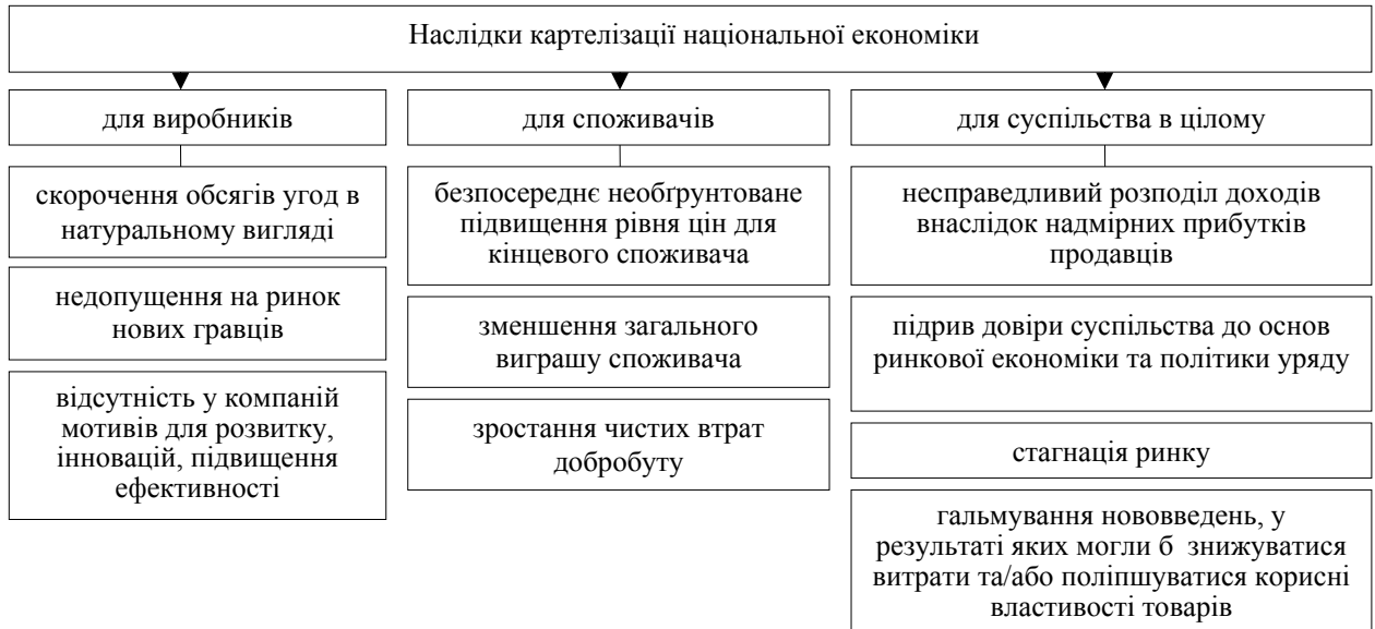
Рис. 2. Наслідки картелізації національної економіки

Обґрунтовано, що наслідки картелізації можуть бути класифіковані за критерієм їх впливу на споживачів, виробників товарів та послуг та суспільство в цілому (рис. 2)