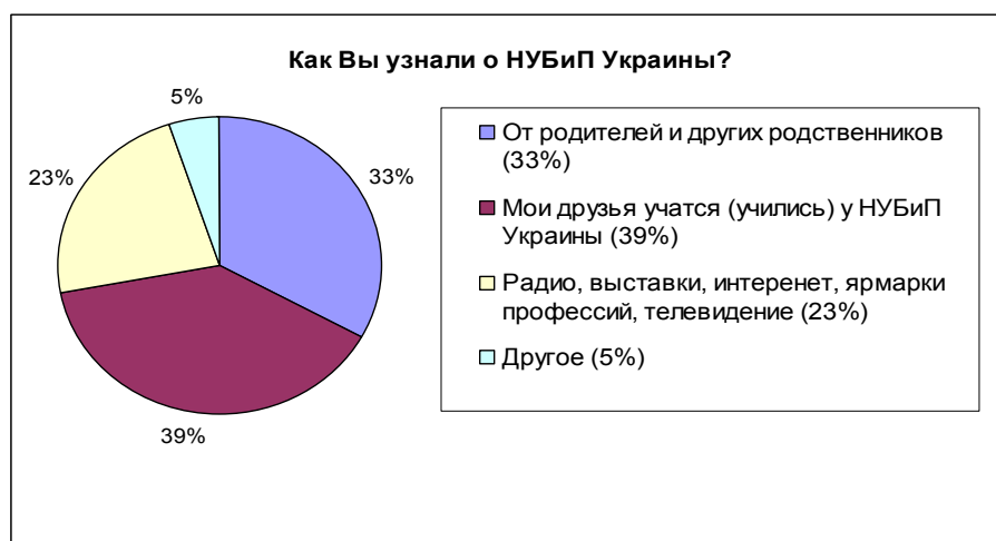
Рисунок 1. Эффективность каналов распространения информации про университет

В анкетировании приняли участие 525 респондентов по всех направлениях подготовки (специальностях), что составляет 6,5 % от общего количества абитуриентов.