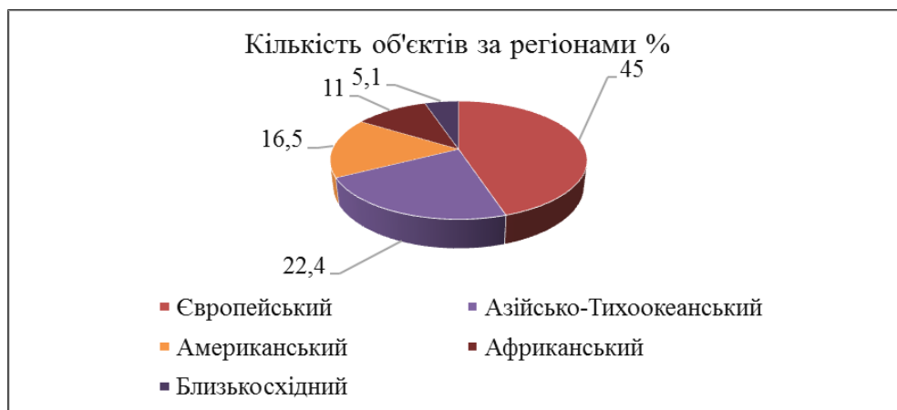
Рис. 2.2. Розподіл об'єктів всесвітньої спадщини ЮНЕСКО за туристичними макрорегіонами ЮНВТО

Рисунок 1.3 означає: третій рисунок першого розділу.