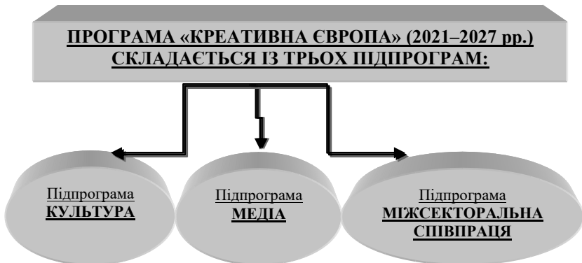
Схема 3. Структура Програми «Креативна Європа» (2021–2027 рр.) 19 .

3) третя підпрограма « Міжсекторальна співпраця » як частина Програми «Креативна Європа» була додана Європейським Союзом до Програми «Креативна Європа» на 2021–2027 роки «сприяє співпраці між різними культурними та креативними секторами, а також охоплює напрямок новинних ЗМІ» через «підтримку медіаграмотності, якісної журналістики, свободи слова та плюралізму» 18 .