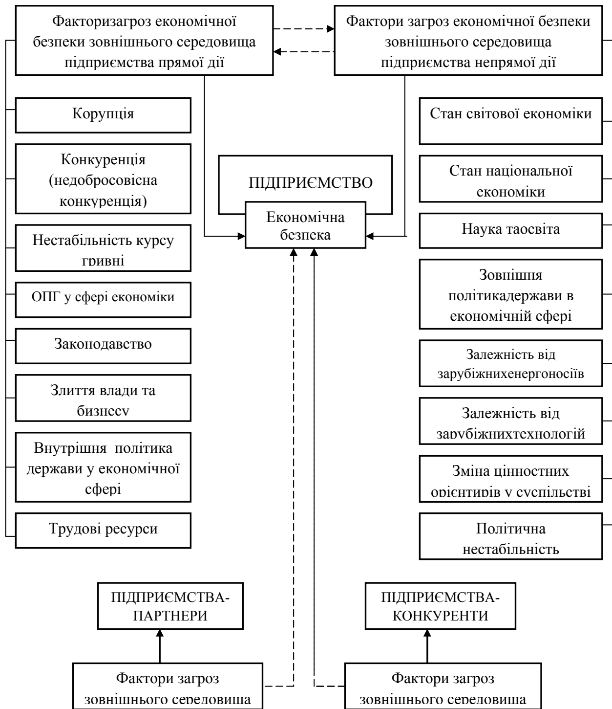
Рис. 2. Модель впливу факторів загроз зовнішнього середовища на економічну безпеку підприємства