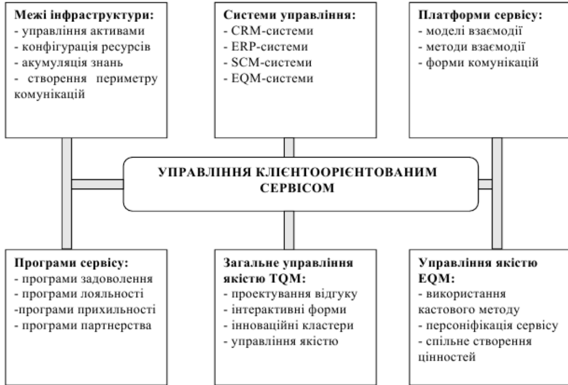
Рис. 1. Модулі управління клієнтоорієнтованим сервісом

Як видно з рис. 1, основними модулями управління клієнтоорієнтованим сервісом є програми сервісу, підсистеми керування, сервісні платформи, інфра-структурні складові та їх межі, а також системи управління якістю. Наявність зазначених модулів дає змогу при управлінні клієнтоорієнтованим логістич-