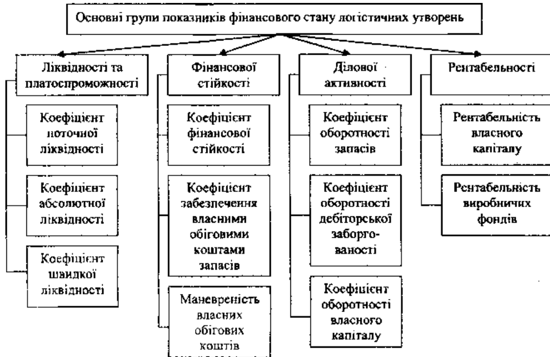
Рис. 2 Основні групи показників діяльності логістичного утворення

безпеки логістичного утворення виступає об'єктивна інформація про підсумки їх виробничо-господарської та фінансової діяльності. Джерелами такої інформації є показники відповідних форм обов'язкової статистичної звітності підприємств. Методика рангування логістичних утворень за рівнем їх фінансової безпеки повинна враховувати найважливіші з показників їх майнового та фінансового стану, ефективності виробничо-господарської та ринкової діяльності тощо.