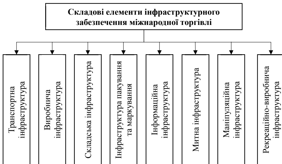
Рис. 2. Елементи інфраструктурного забезпечення міжнародної торгівлі