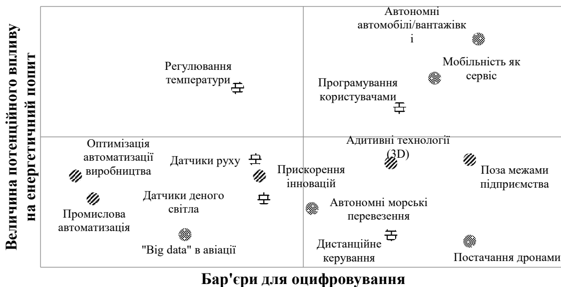
Рис. 1. Потенційний вплив цифрових технологій на транспорт, будівлі та промисловість

Інтелектуальні термостати можуть передбачати поведінку мешканців (на основі минулого досвіду) та використовувати прогнози погоди в режимі реального часу, щоб краще прогнозувати потреби в опалюванні та охолодженні. Розумне освітлення може забезпечити більше, ніж просто світло, коли і де це потрібно; світлодіоди також можуть включати датчики, пов'язані з іншими системами, наприклад, допомагаючи адаптувати послуги опалення та охолодження.