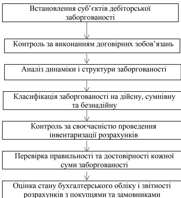
Рис. 1. Послідовність проведення контролю розрахунків з покупцями та замовниками

4. Якщо покупець відмовився прийняти та оплатити товар, продавець має право за своїм вибором вимагати оплати товару або відмовитися від договору купівлі-продажу.