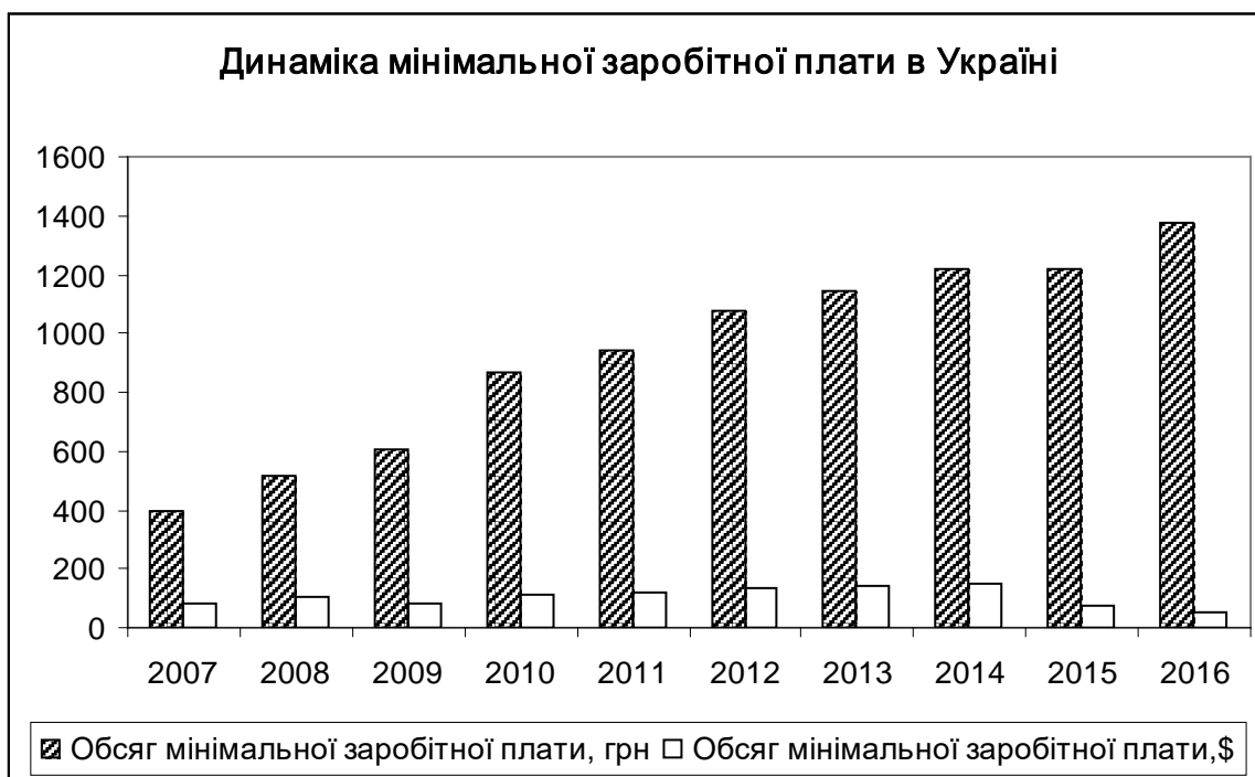
Мал. 2. Динаміка мінімальної заробітної плати в Україні

складає 47 євро. Її зміни у гривневому та доларовому еквіваленті за останні десять років демонструє така діаграма (Мал. 2).