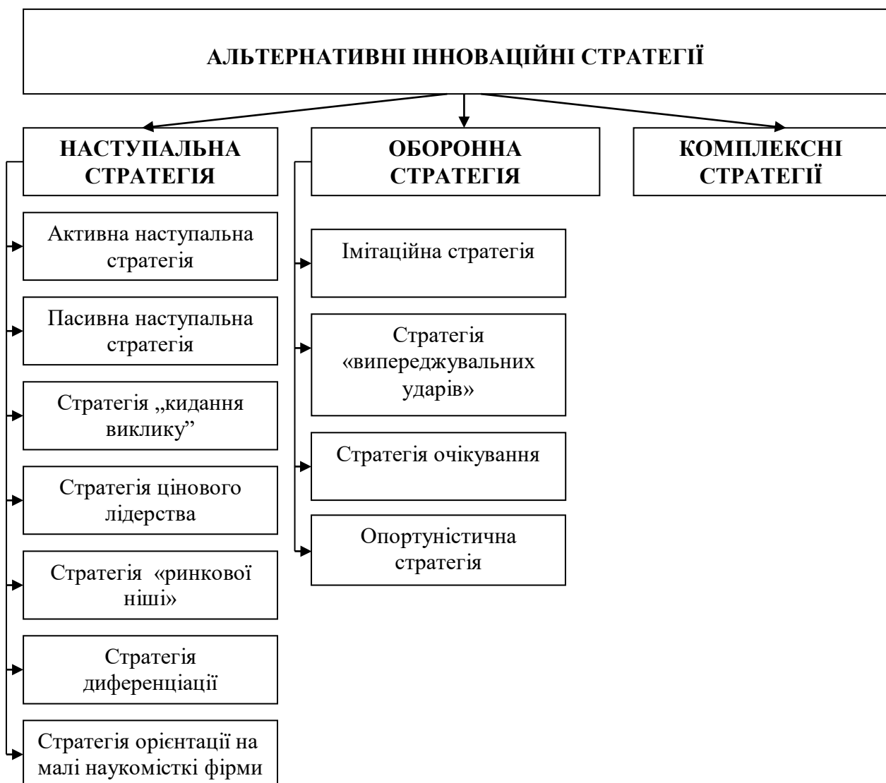
Рис. 2. Структура інноваційних стратегій з точки зору стратегічних альтернатив функціонування організаційно-економічного механізму.

3) Безпосередньо вибір стратегії. При виборі альтернативних стратегій інноваційної діяльності пропонуємо керуватися такою класифікацією інноваційних стратегій (Рис. 2).