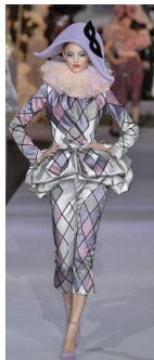
Рис. 3. John Galliano. Колекція haute couture осінь/зима 2007–2008 рр.

Мажорна, життєствердна інтерпретація образу Арлекіна характерна для колекції John Galliano haute couture осінь/зима 2007–2008 рр. Особливістю дизайнерського рішення є «множинне інтертекстуальне посилання» на костюм персонажа commedia dell'arte , полотна П. Пікассо і стилістику «New Look». Так, на зв'язок із театральною маскою вказують сорочка, кальцони, комір – млинове жорно і характерний ромбовидний принт, а апеляцію до Christian Dior підкреслюють романтична вишуканість та Х-подібний силует. «Самоцитуванням» John Galliano сприймається стилізація головного убору під бікорн, поширений у колекціях дизайнера попередніх років («Наполеон і Жозефіна», haute couture весна/літо 1992 р. та ін.). Семантичної ємності моделі надають перегуки з роботами П. Пікассо «Арлекін, що оперся на лікоть» (1901), «Акробат і Арлекін» (1905), «Арлекін, що сидить» (1923).