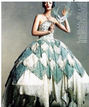
Рис. 1. John Galliano. Сукня з принтом, що асоціюється з костюмом Коломбіни. Колекція haute couture весна/літо 1998 р.

Характерне для постмодернізму «множинне інтертекстуальне посилання» на костюм Коломбіни, традиційне японське жіноче вбрання і стиль «New Look» зустрічаємо в колекції John Galliano haute couture весна/літо 2007 р.