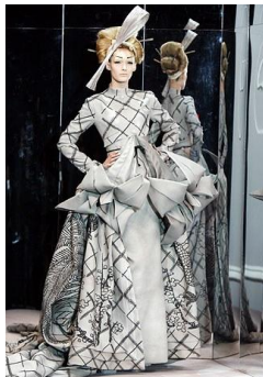
Рис. 2. John Galliano. Синтез мотивів костюма Коломбіни та японського традиційного вбрання. Колекція haute couture весна/літо 2007 р.