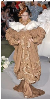
Рис. 4. John Galliano. Творча інтерпретація костюма П'єро commedia dell'arte . Колекція haute couture осінь/зима 2007–2008 рр.

«Множинне інтертекстуальне посилання» на commedia dell'arte , образ Арлекіна і полотна Пабло Пікассо «Арлекін, що схилився» (1901, Метрополітен-музей, Нью-Йорк) та «Арлекін музикант» (1924, Національна галерея мистецтв, Вашингтон, США) зустрічаємо у репрезентованій на Міланському тижні моди колекції Jeremy Scott бренду Moschino весна/літо 2020 р. Особливістю дизайнерської концепції є цитування, нові контекстуалізація та інтерпретація цілісного культурного образу та асоціативні перегуки з твором живопису.