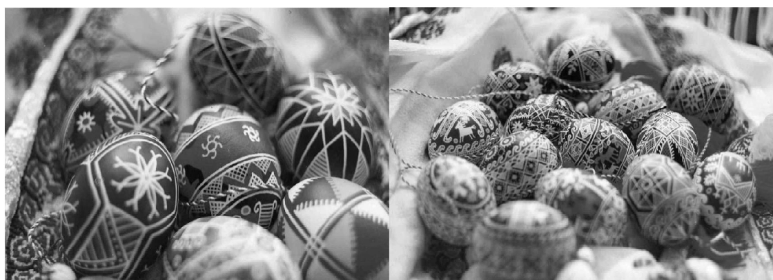
Рис.7-8. Авторські роботи. Приватна колекція, Франція 2004 рр.

Орнаментальні мотиви писанки становлять звіт традиційних малюнків, що зберігають численні семантично-символічні значення. Кожна писанка, створена сучасною писанкаркою або писанкарем, зберігає свої прийоми поділу поверхні, що декорується, будови нанесених мотивів, їх положення на поверхні, яке відповідає прадавнім тлумаченням світобудови, зберігаючи стародавні коди орнаментальних структур, продовжуючи цю давню традицію в сучасному мистецькому просторі.