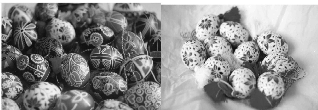
Рис.5-6. Авторські роботи. Приватна колекція, США 2000 рр.

У своїй статті «Про таємничу символіку писанки» О. Гуцуляк [2, 12] у домінуванні червоних кольорів в писанковому тлі вбачає її безсумнівну належності до культу сонця.