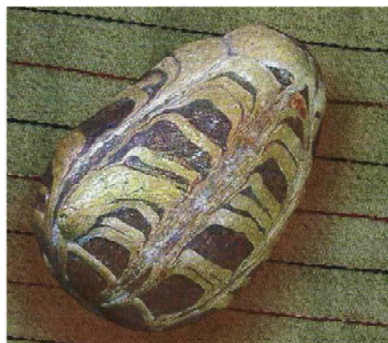
Рис. 1. Давня писанка княжої доби, знайдена під час розкопок решток церков на Царинці (с. Кринос – давній Галич) 1992 р. (Галицька археологічна експедиція, керівник Ю. Лукомський). XII–XIII ст. [5].

На підставі проаналізованих археологічних знахідок, не має певного ствердження, що вищезазначені рештки прадавніх ритуальних яєць мають стосунок до сучасної писанки, бо малюнки та розписи на шкарлупах не збереглися, а отже, не має підстав вважати, що вони там були присутні. Нестача матеріальних підтверджень рештків писанок ранніх періодів дає змогу лише зробити припущення, що орнаменти давньої писанки ідентичні до сучасних. Таке припущення можна ще зробити виходячи з того, що писанки, які є в наявності в експозиціях музеїв та, які були зафіксовані етнографами протягом останніх ста років (перший альбом – 1899 року), демонструють притаманну їм статичність у плані змін орнаментального забарвлення. Визначний український антрополог Хв. Вовк у 1872 році вперше звертає увагу на писанковий орнамент, проводячи численні паралелі його структурної суті з орнаментальним розписом первісної кераміки. Маємо на увазі лише припущення, що, як і решта ритуальних елементів, які були традиційно поховані разом із прадавніми слов'янами: ритуальна кераміка, одяг, прикраси, знаряддя та зброя і мали численні гаптування та нанесення великої кількості орнаментів, знаків та символів, яйця, що присутні в похованнях, також мали на собі елементи сакральної язичницької символіки.