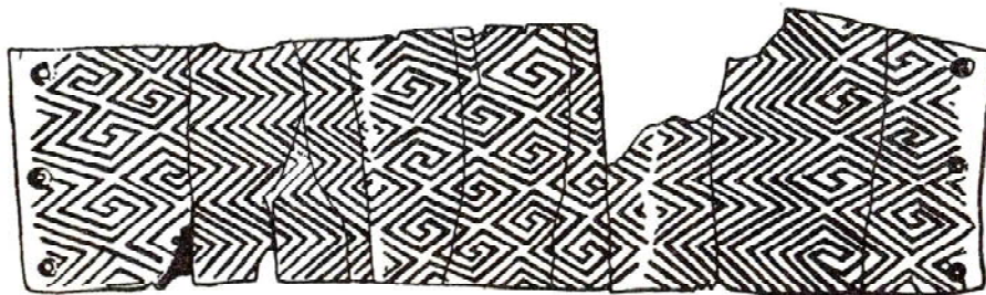
Рис.2. Меандр, виритуваний на браслеті зі слонової кістки, Мізин, Чернігівщина

Починаючи із часу палеоліту розвивається геометричний малюнок, у символах якого відображено світогляд людей первіснообщинного ладу. Порівнюючи елементи орнаменту на галунках із Мас д'Азиля, знайдені П'єттом, з багато-орнаментованим бивнем мамонта Кирилівської стоянки в м. Києві та рядом предметів з Мізинської палеолітичної стоянки на Чернігівщині (рис.1), оздоблених прекрасним за своєю довершеністю орнаментом, що присутній в незмінному вигляді в сучасній писанці (рис. 2, 3), що сприяє ознайомленню сучасника із знаками, із допомогою яких, наші пращури ідентифікували духовний початок, навколишнє середовище, тобто природу, всесвіт та його будову, своє місце в ньому.