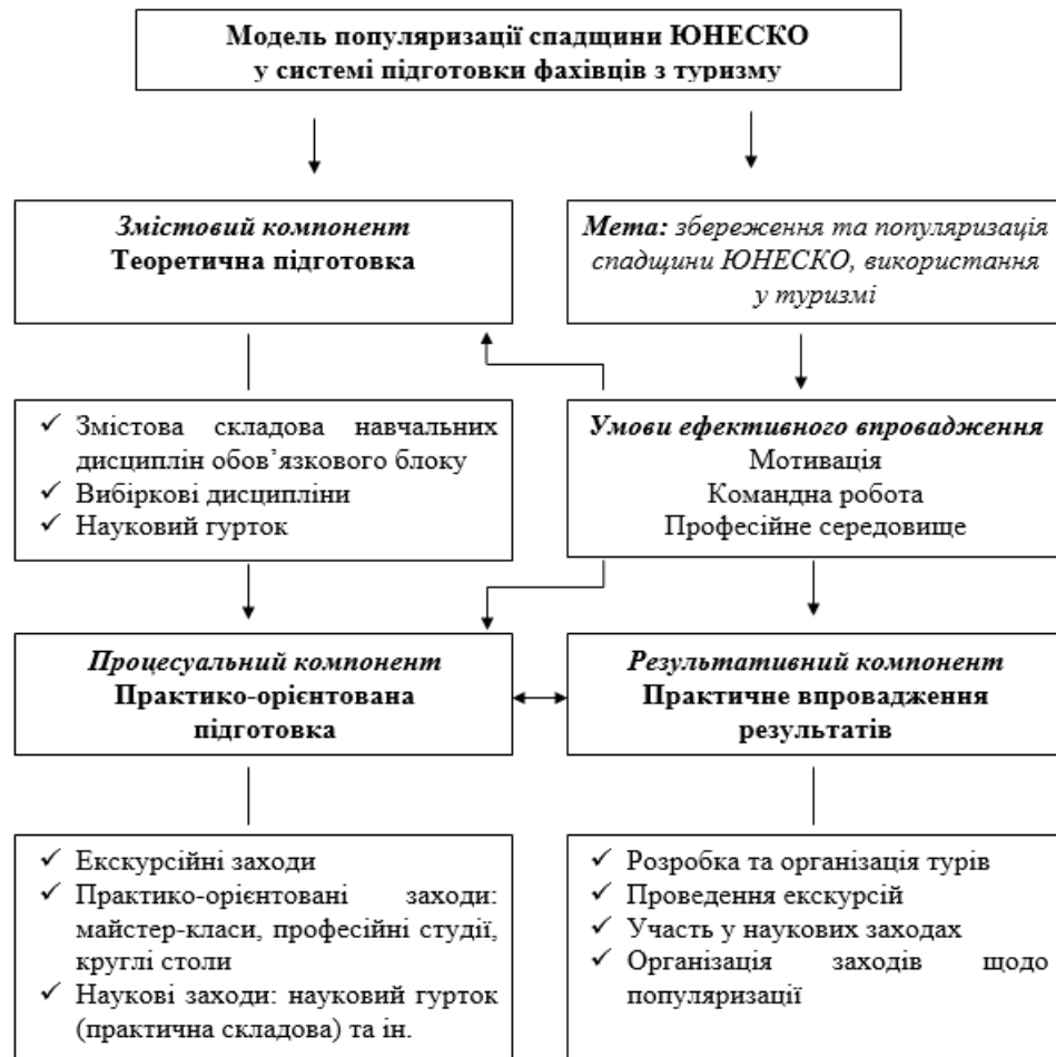
Рис. 1. Модель популяризації спадщини ЮНЕСКО у системі підготовки фахівців з туризму