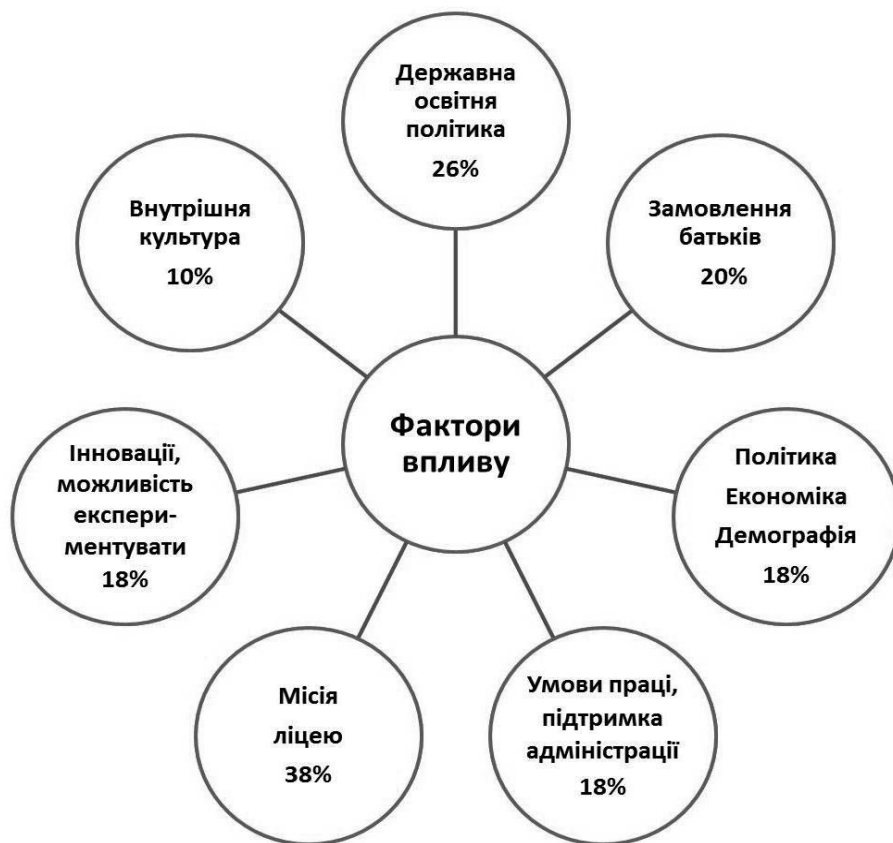
Рис. 2. Фактори впливу на мотивацію діяльності вчителів

силля спрямовані на формування педагогічного простору, сприятливого для самопрояву, самоорганізації, саморозвитку всіх ліцеїстів і вчителів. Особливий акцент в організаційній культурі ліцею зроблено на активізацію засад самоорганізації та саморозвитку як ключових цінностей сучасної