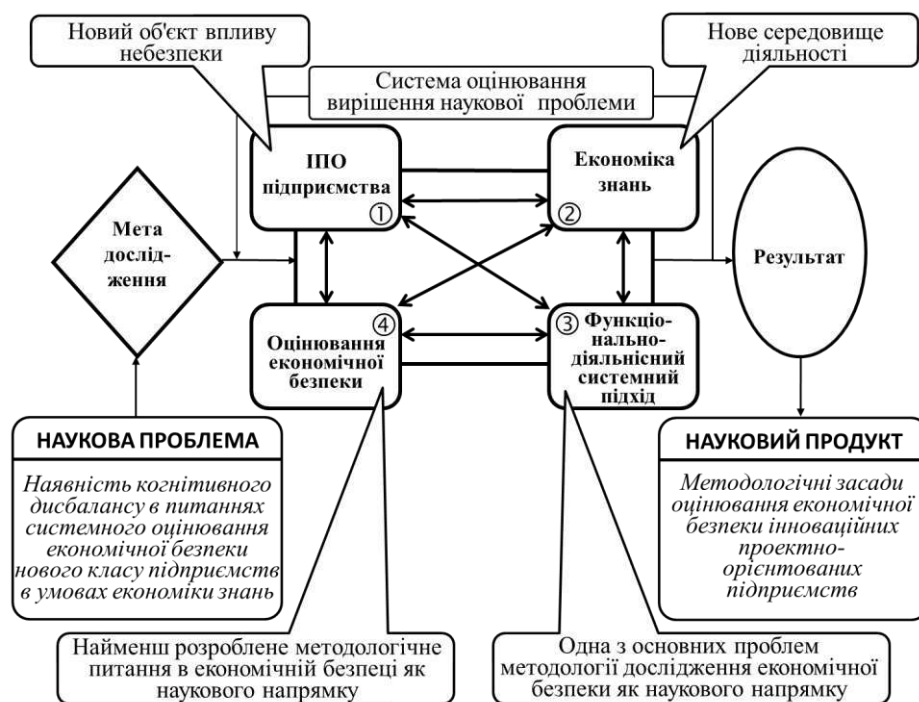
Рис. 2. Системне представлення наукової проблеми оцінювання економічної безпеки ІПО підприємств

економічної безпеки, а також розкриває особливості діяльності ІПО підприємства з функціонування та розвитку.