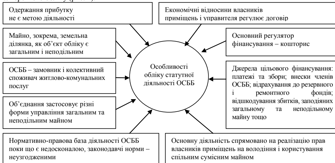
Рис. 1. Чинники, які зумовлюють особливості обліку статутної діяльності ОСББ [15, с.124].

Враховуючи специфіку діяльності ОСББ, структуру їхніх активів, капіталу, характер зобов'язань, доходів і витрат, способи розрахунків, можна виділити низку чинників, що зумовлюють основні особливості бухгалтерського обліку (рис. 1).