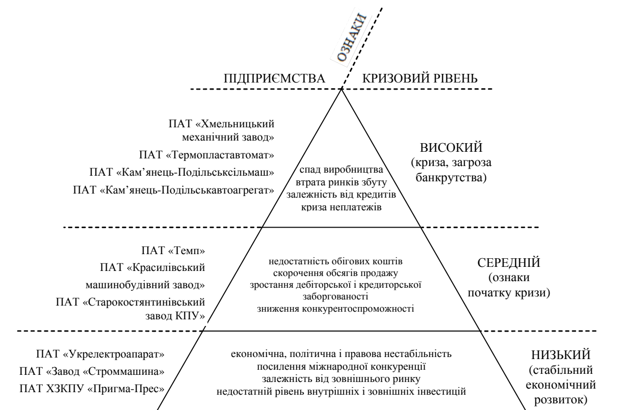
Рис. 2. Класифікація машинобудівних підприємств Хмельниччини відповідно до кризового рівня діяльності

з середнім рівнем – підприємства, які мають первинні ознаки початку кризи, з високим рівнем – підприємства, які перебувають в кризі і знаходяться на грані банкрутства, і тому потребують негайного застосування заходів щодо попередження та подолання банкрутства.