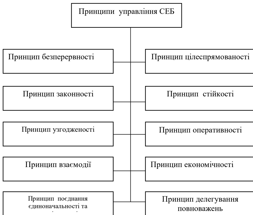
Рис.3. Принципи функціонування системи управління комплексним забезпеченням економічної безпеки підприємства

кількості складних завдань у різних сферах, у тому числі інформаційної, техніко-технологічної, фізичного захисту, фінансової, кадрової та інших. Для того, щоб захиститися від них і забезпечити економічну безпеку, необхідний високий рівень професіоналізму, знання сучасних технологій, технічних засобів і методів протидії небезпекам і загрозам економічної безпеки підприємства. Тому керівник системи економічної безпеки підприємства делегує частину своїх повноважень керівнику штатного підрозділу економічної безпеки, а також керівникам інших структурних підрозділів, у тому числі юридичного відділу, маркетингу, фінансово - економічного, виробничого, головного інженера, головного технолога та інших.