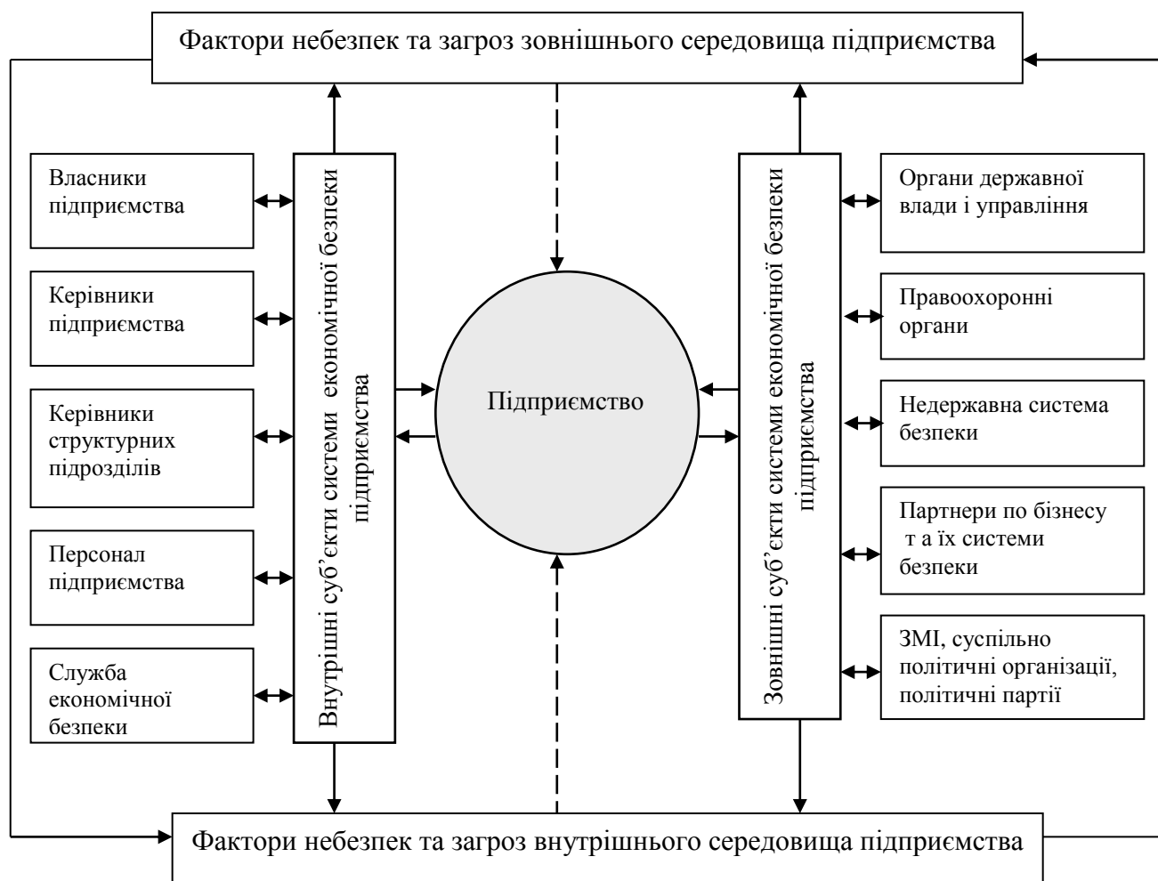
Рис. 2. Реально і потенційно зацікавлені в забезпеченні економічної безпеки суб'єкти системи економічної безпеки підприємства

економічної безпеки підприємства, у забезпеченні економічної безпеки підприємства.