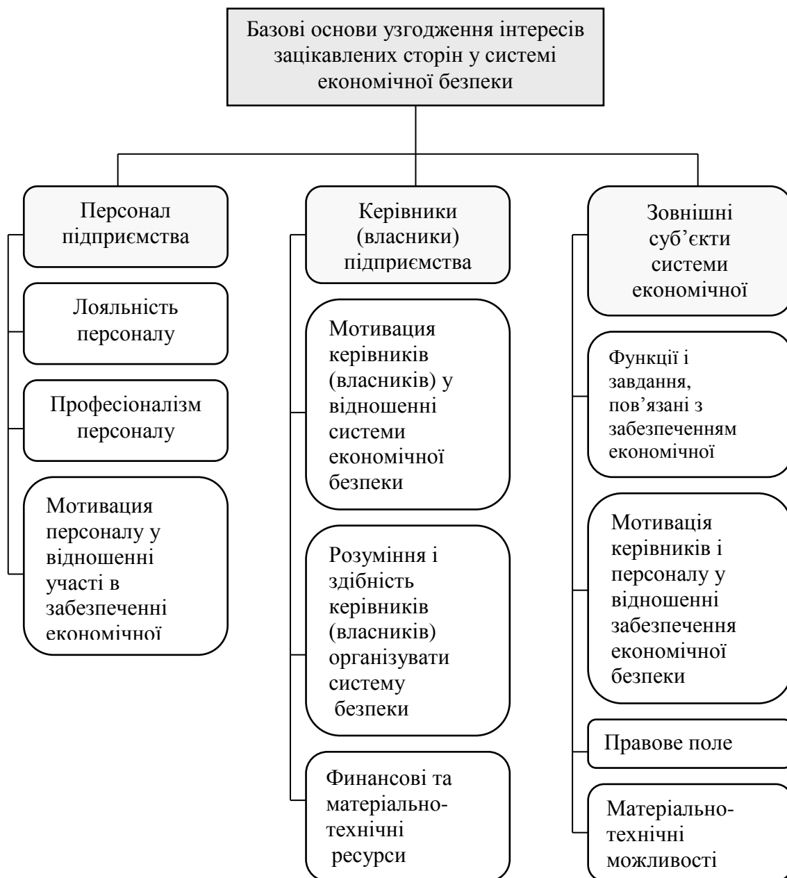
Рис. 3. Структура базових основ узгодження інтересів зацікавлених сторін у системі економічної безпеки

на ринку. Причому це стосується як внутрішніх суб'єктів системи економічної безпеки, так і зовнішніх.