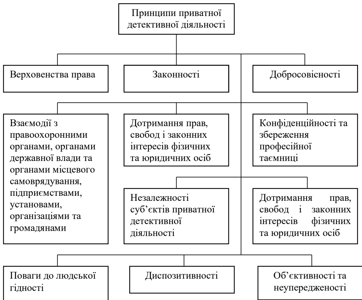
Рис.1. Основні принципи здійснення приватної детективної діяльності

Приватна детективна діяльність є дуже складним і відповідальним видом професійної діяльності в галузі безпеки. Він здійснюється на основі принципів, які представлені на рисунку 1.